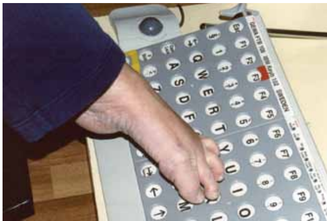
Isoa näppäimistöä ja pallohiirtä on helppoa käyttää varpaalla.

Ohjaimen ja siihen liittyvien ohjelmien valintaan vaikuttavat käyttäjän kognitiiviset ja sensomotoriset valmiudet kuten näkö-, kuulo- ja tuntoaisti sekä hahmottaminen, liikkeiden hallinta, muisti ja keskittyminen.