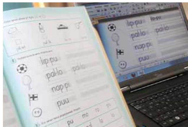
Tehtäväkirja voidaan siirtää tietokoneelle täydennettäväksi.

Opiskelijalle voidaan valmistaa yksilöllistä opetusmateriaalia tai siirtää perinteiset kynä-paperitehtävät skannerin avulla tietokoneelle. Verkossa toimivat oppimisympäristöt helpottavat opiskelua ja laajentavat etäopiskelun mahdollisuuksia.