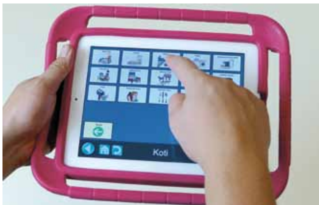
GoTalk Now -kommunikointiohjelma iPadillä.

Tietoteknisiksi laitteiksi luetaan yleensä pöytä-, kannettavat- ja tablettitietokoneet sekä älypuhelimet. Näihin laitteisiin on saatavilla erilaisia ohjelmia ja sovelluksia, jotka helpottavat laitteiden käyttöä tai tukevat henkilön toimintakykyä.