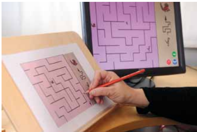
Ohjelmista voidaan myös tulostaa kuvia ja jatkaa työskentelyä kynällä.

Kielellisiä ja matemaattisia valmiuksia harjoittavia ohjelmia hyödynnetään opetuksessa ja kuntoutuksessa.