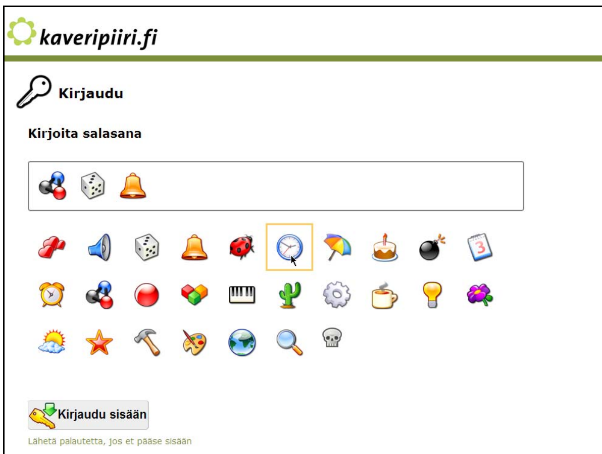
Kuva 2. Kuvasalasaana