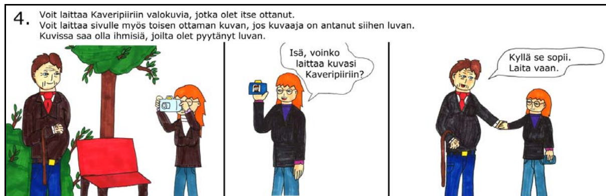
Kuva 3. Sarjakuva havainnollistaa palvelun sääntöjä.