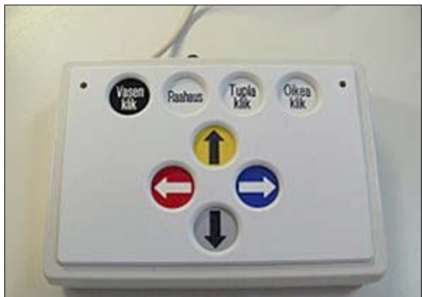
Yllä olevissa kuvissa hiiren toiminnot on viety painikkeille. Vasemmalla on ohjelmoitava näppäimistö, johon voi asentaa erilaisia näppäin- tai hiiriratkaisuja. Oikealla hiiritoiminnot näppäimillä.