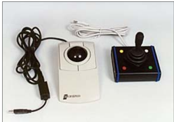
Erilaisia hiiriratkaisuja. Vasemmalla on pallohiiri ja oikealla pallohiiri sekä sauvahiiri.