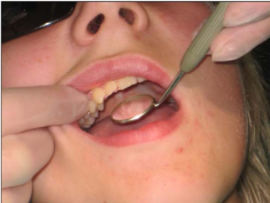
Lääkäri katsoo hampaita.