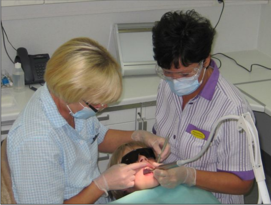
Lääkäri ja hoitaja työskentelevät yhtä aikaa.