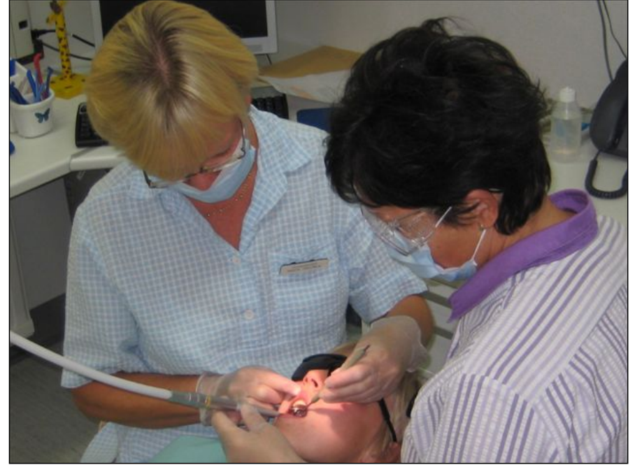
Hoitaja voi käyttää imuria syljen poistamiseen.