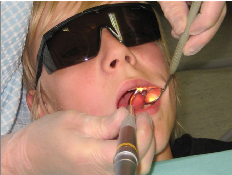
Hampaita voidaan tutkia myös valolla.