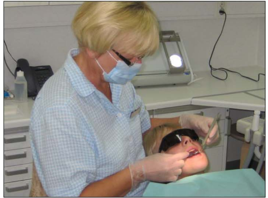
Lääkärillä on maski ja kumihansikkaat.