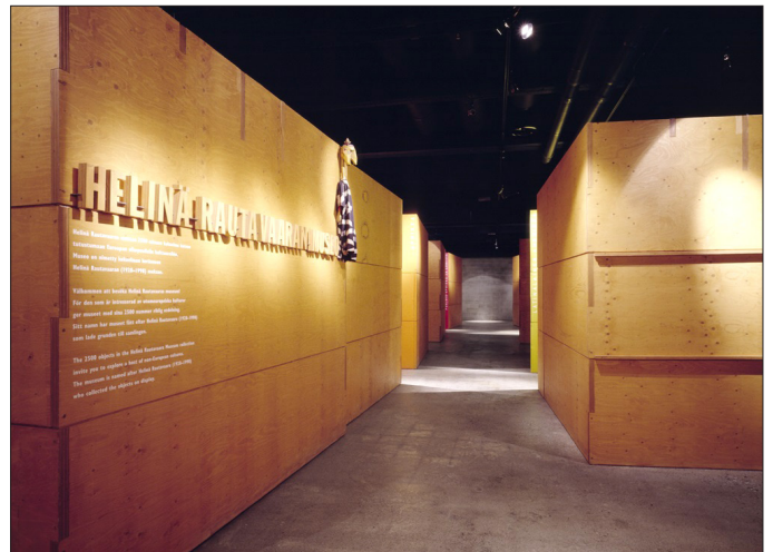
Museon aula ja käytävä.