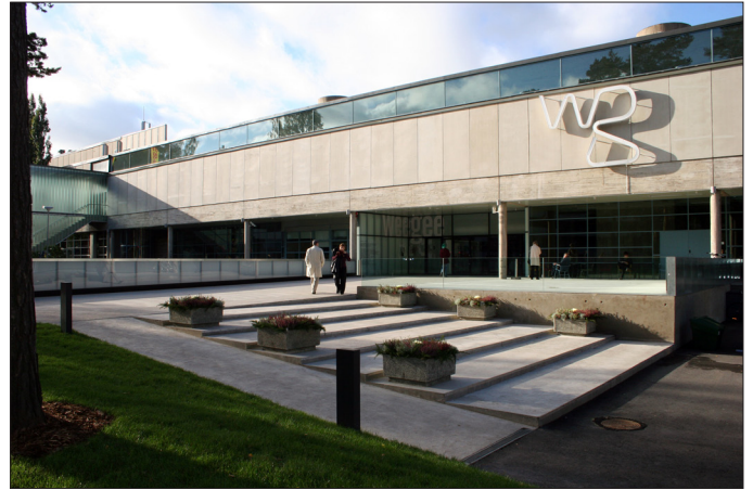
Helinä Rautavaaran museo sijaitsee WeeGee-talossa Espoossa.

modernin taiteen museo EMMA, Lelumuseo Hevosenkenkä, Espoon kaupunginmuseo KAMU ja Suomen Kellomuseo.