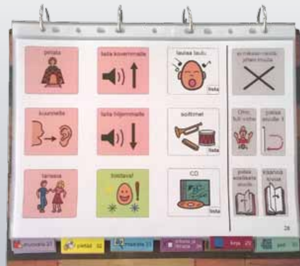
ALKU-kommunikointikansion kuvia käytetään ilmaisun avainsanoina.

Sanastoltaan laajat kommunikointikansiot mahdollistavat monipuolisen, lause-tasoisien ilmaisun. Samalla kansion aukeamalla on useiden sanaluokkien merkkejä, jolloin lauseen voi parhaimmillaan muodostaa sivua kääntämättä. Tämä lauseiden muodostamisen helppous tekee kansiota toimivan, ”dynaamisen”.