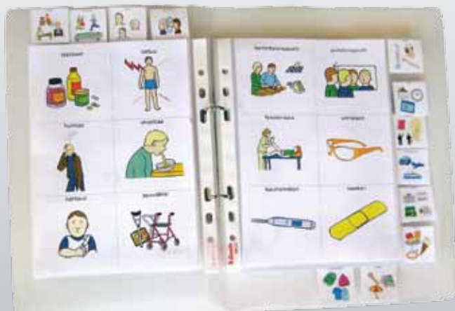
Papunetin kuvatyökalulla voi itse rakentaa ja tulostaa aikuisille tarkoitetun kommunikointikansion.