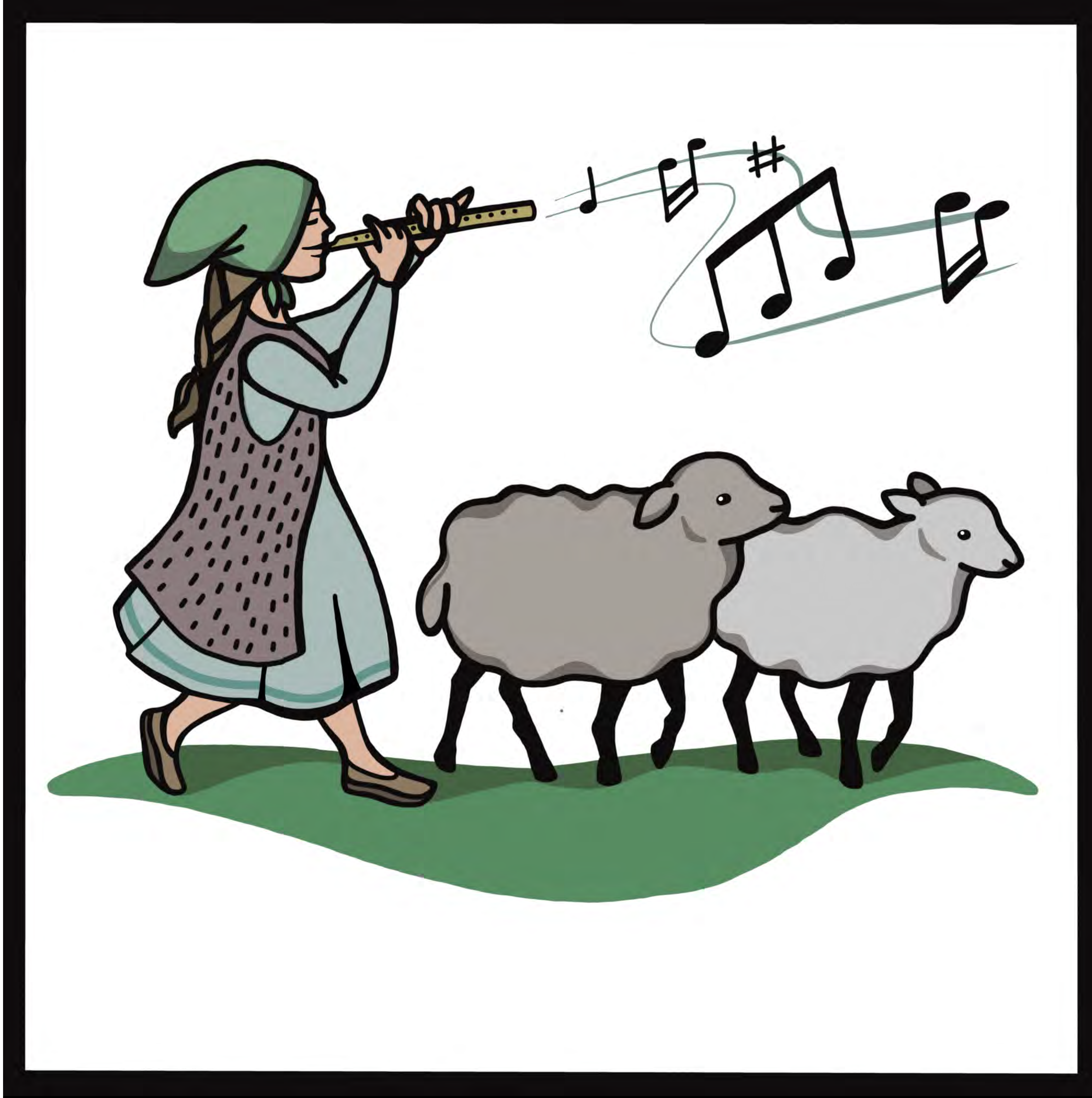
Paimenen soitanto laitumen tiellä