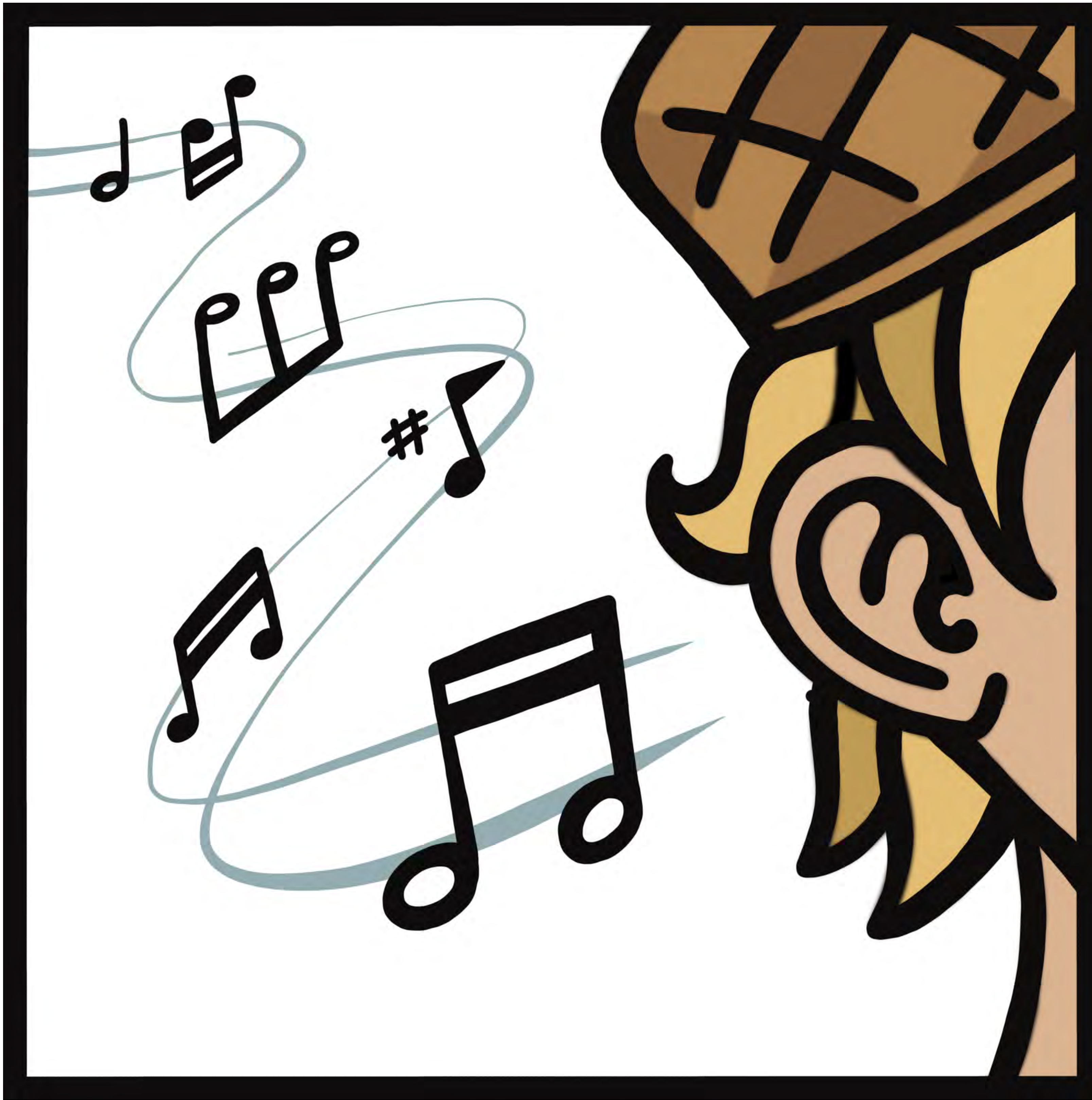
Ääntänsä korviini vilistää.