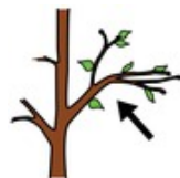
lehtipuu kasvattaa uudet lehdet.