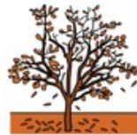
kellastuvat ja putoavat maahan