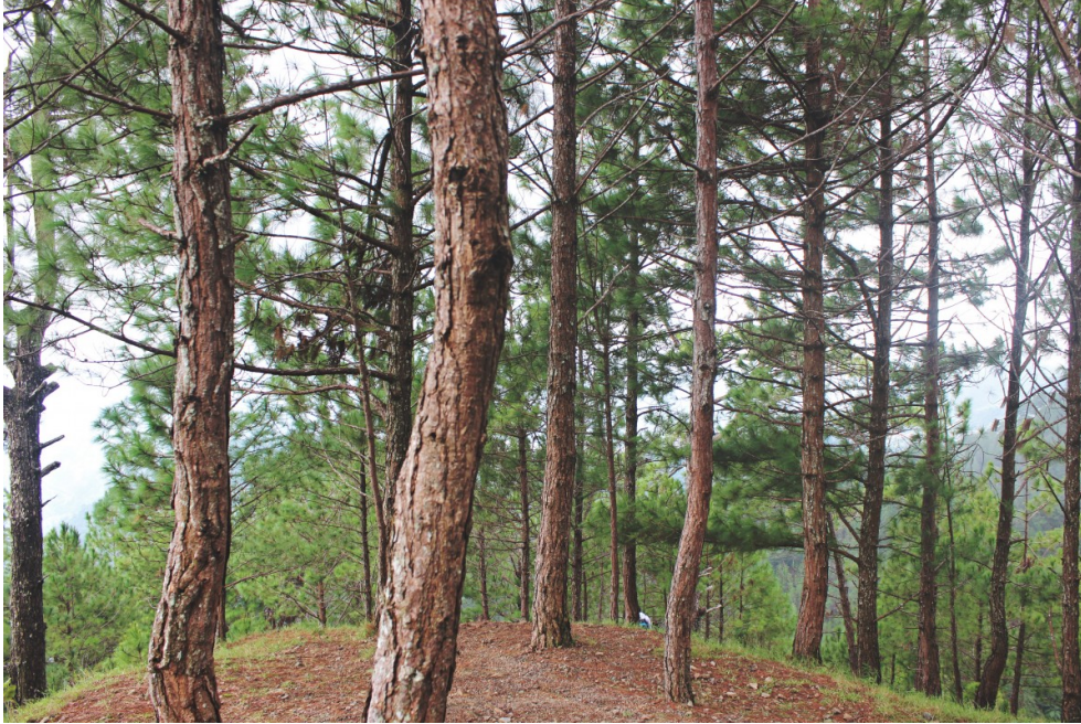
Mänty on havupuu.