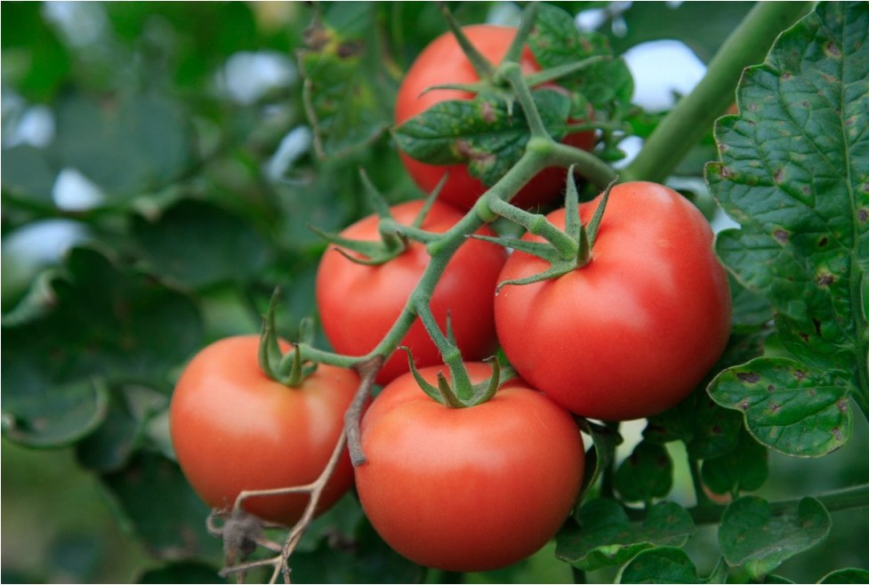
Tomaatti kasvaa puutarhassa.