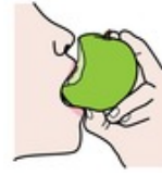
ja puraisi palan pois.