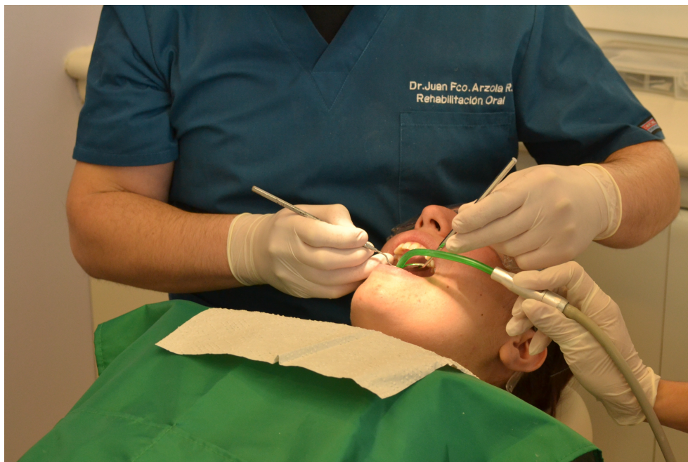
Hammaslääkäri hoitaa hampaita.