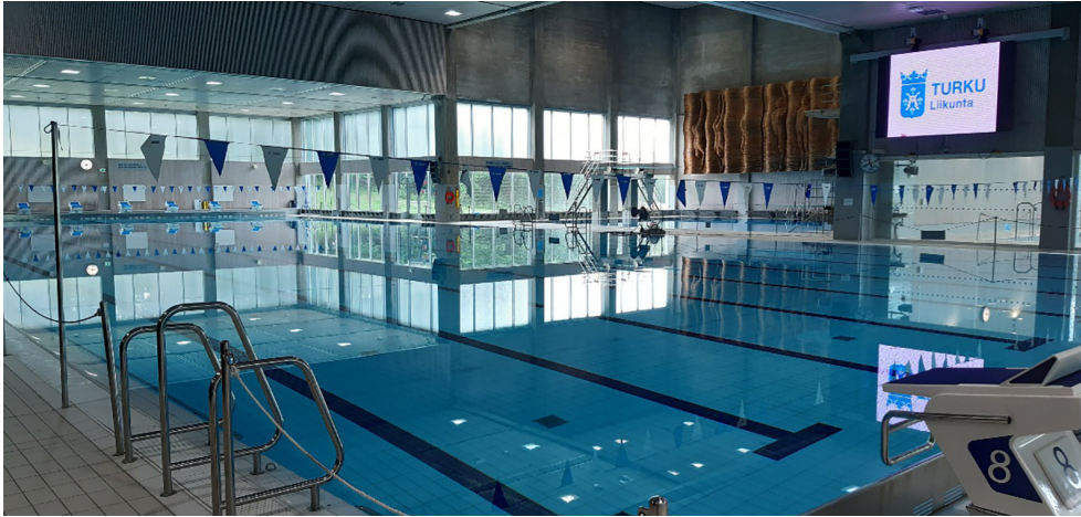
Impivaaran uimahalli Turussa on Suomen suurin uimahalli.